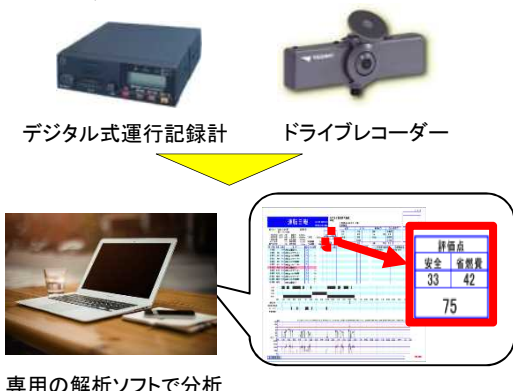
専用の解析ソフトで分析

運転者の運転傾向の把握や、事故時の映像データを活用することにより、運転者の安全意識の向上及び事故調査等の高度化により事故防止を図る